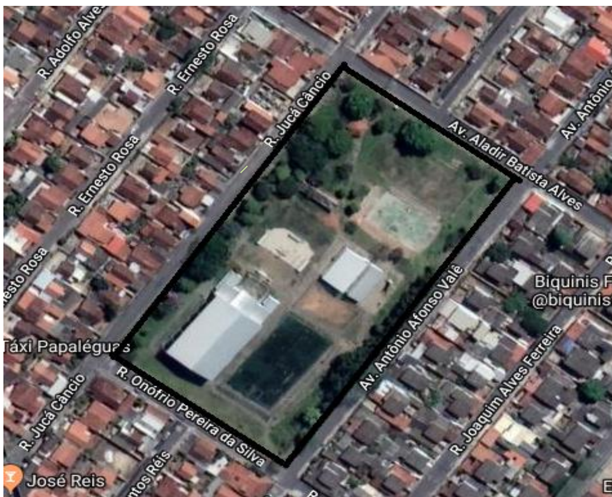
Imagem de Satélite - PRAÇA DA JUVENTUDE